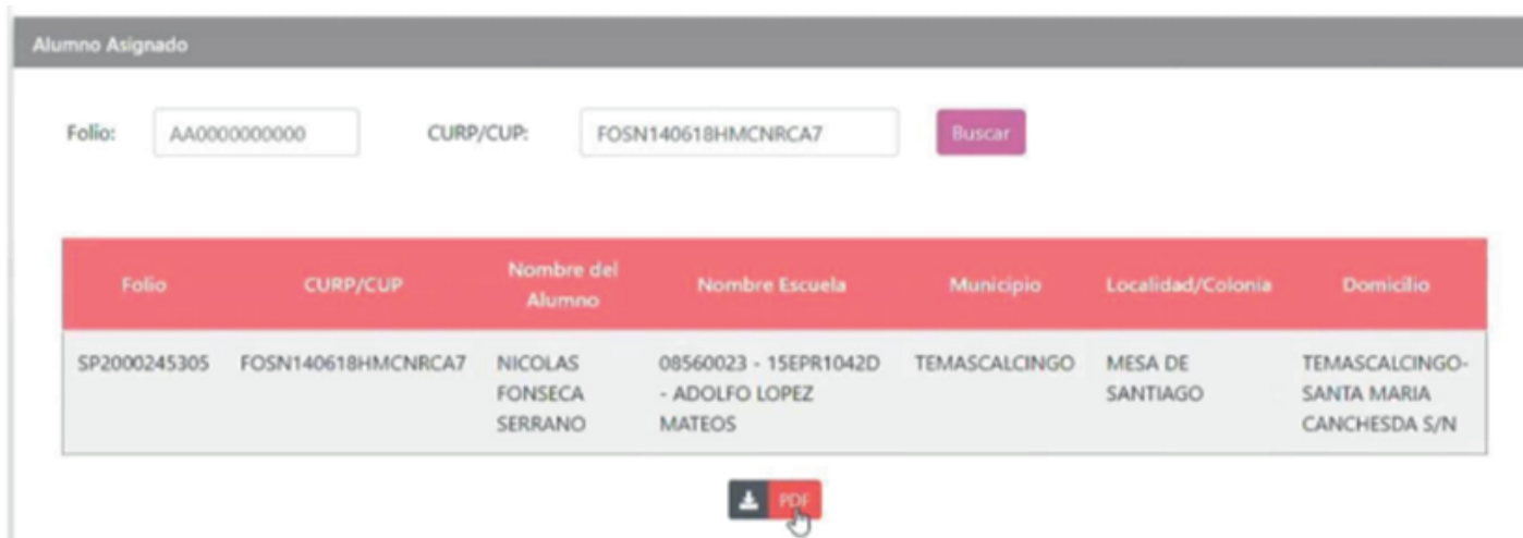
Imagen 2 Pantalla de despliegue de resultado de la asignación.

Si los datos están correctos, el sistema desplegará la pantalla que se muestra en la Imagen 2. Para descargar el archivo a imprimir se debe pulsar el botón “PDF” que aparece al fondo de la Imagen 2