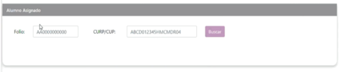
Imagen 1-Pantalla de Ingreso a la consulta de resultados.

NOTA: Dependiendo del campo que elija para acceder al Sistema, es importante que el otro no contenga información para que pueda habilitarse.